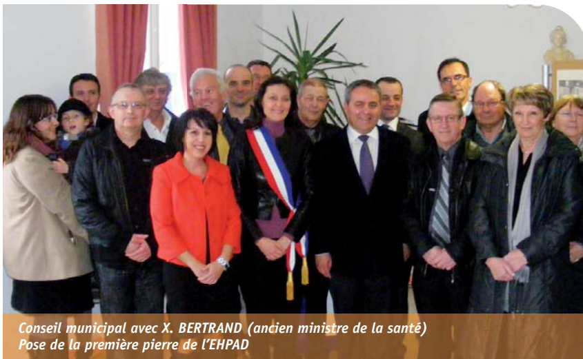
Conseil municipal avec X. BERTRAND (ancien ministre de la santé) Pose de la première pierre de l'EHPAD

3- Dans le cadre du développement du secteur de la Petite Enfance et de la jeunesse, nous avons souhaité une plus large ouverture du centre aéré. Déjà ouvert aux vacances de Pâques, il sera ouvert du 6 au 31 juillet puis aux vacances de la Toussaint.